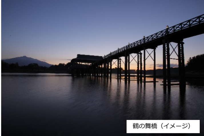
鶴の舞橋（イメージ）