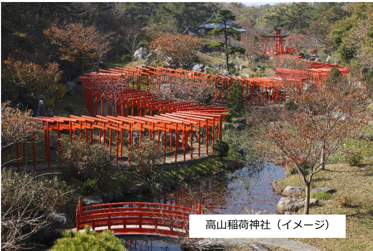
高山稲荷神社（イメージ）