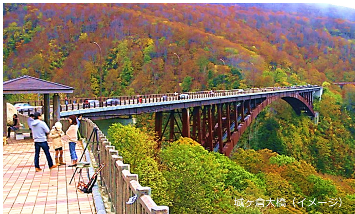
城ヶ倉大橋 (イメージ)