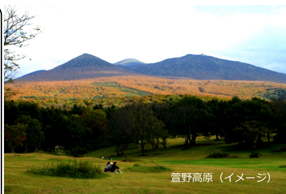
萱野高原 (イメージ)