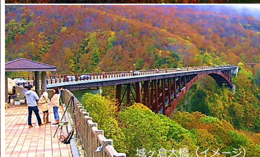
城ヶ倉大橋 (イメージ)