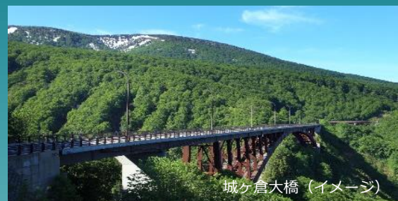
城ヶ倉大橋 (イメージ)