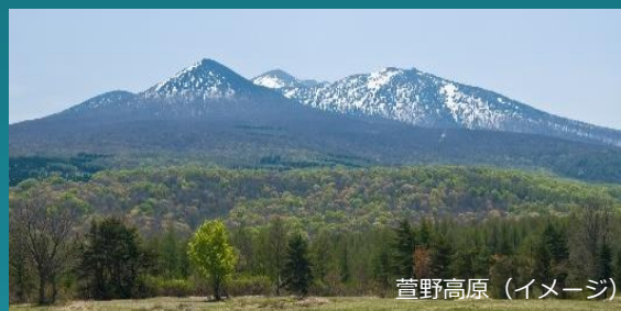
菅野高原 (イメージ)