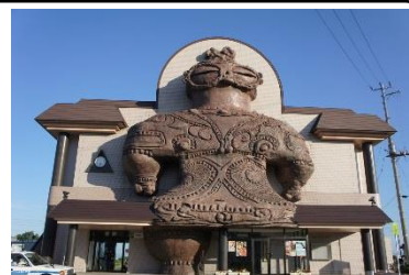
木造駅舎 (イメージ)