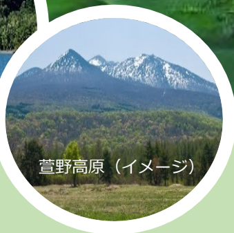
萱野高原（イメージ）