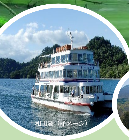
十和田湖（イメージ）